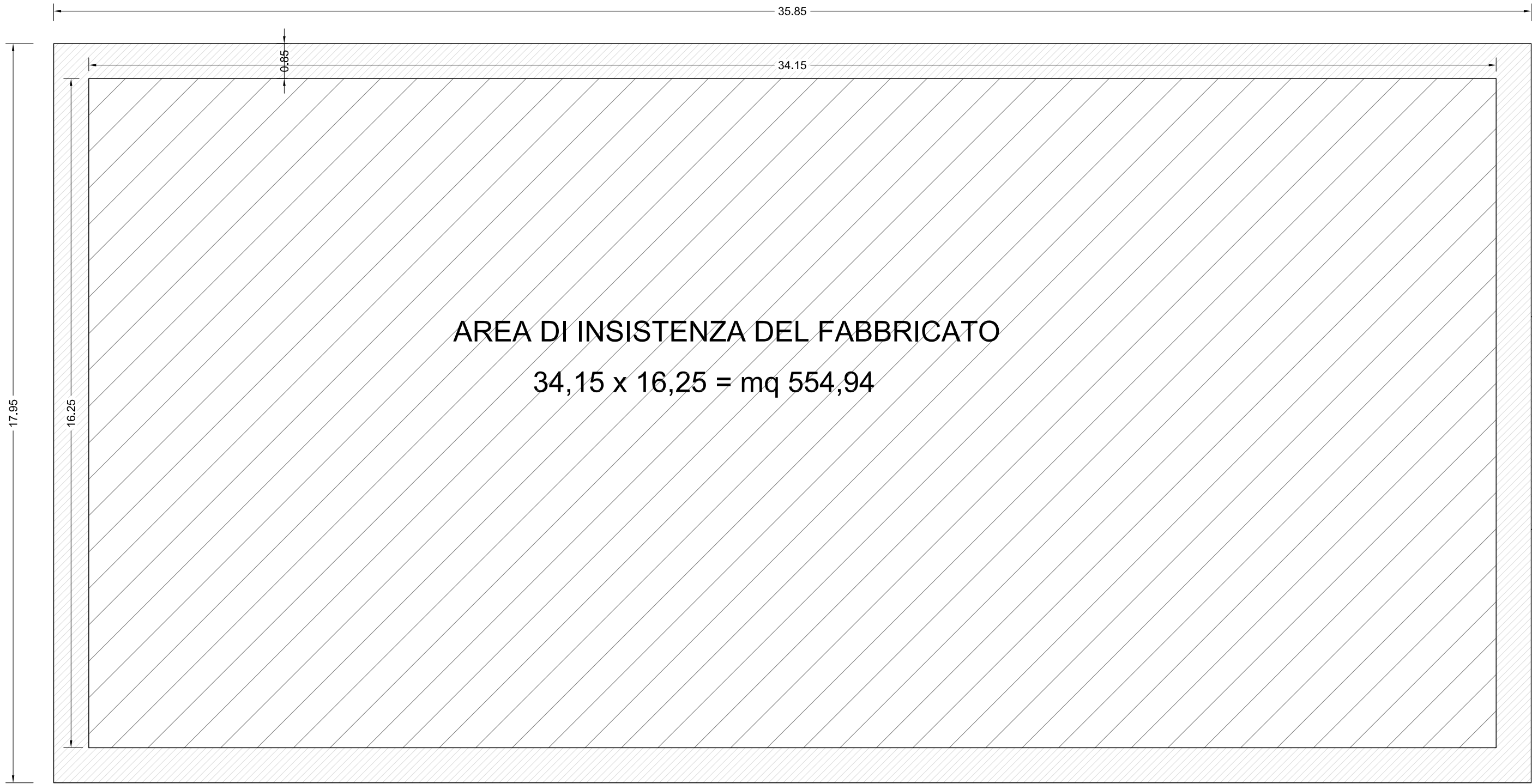
LOTTO 5 PIANTA PIANO INTERRATO